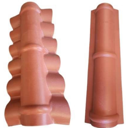
TABLA DE EQUIVALENCIAS DE CABALLETES TEJAFLEX